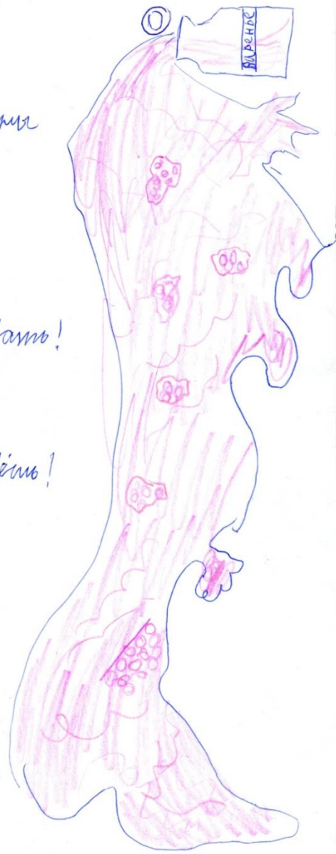
Описание Беата 2 "б" класс.

-А вы знаете, что КЛЛ! А вы знаете, что БА? А вы знаете, что СА?